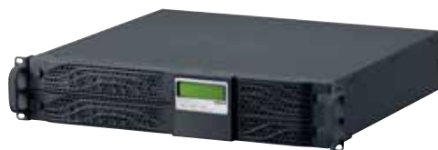
3 100 45